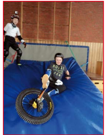
Ole macht Pause