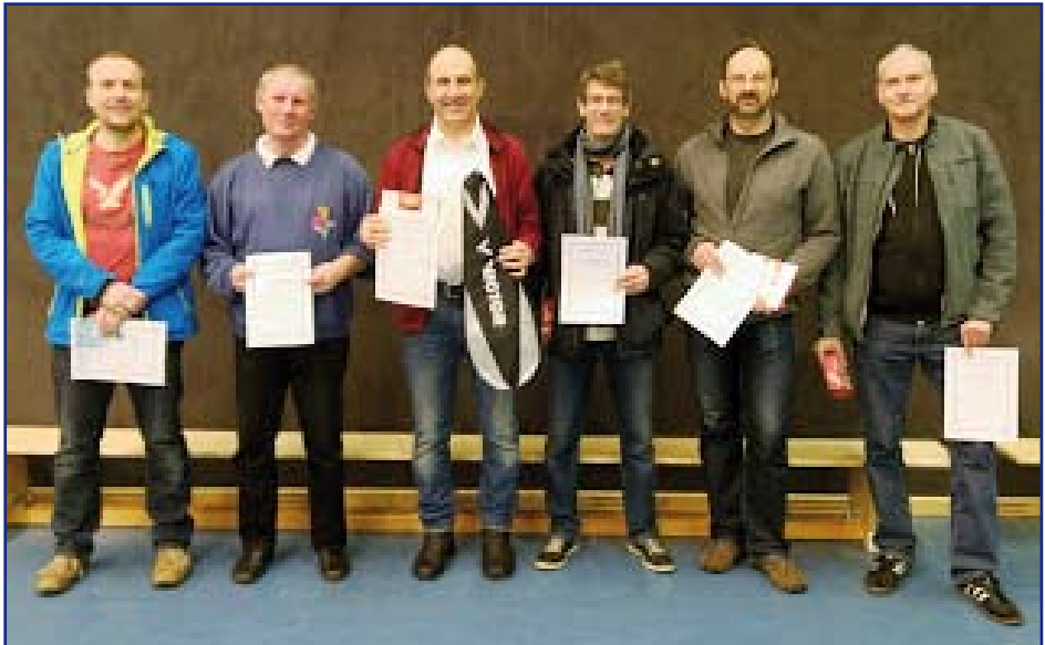
Siegerehrung Doppel - Hamburger Meister 2015