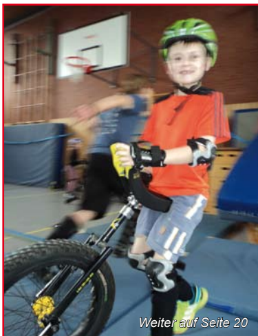
Weiter auf Seite 20