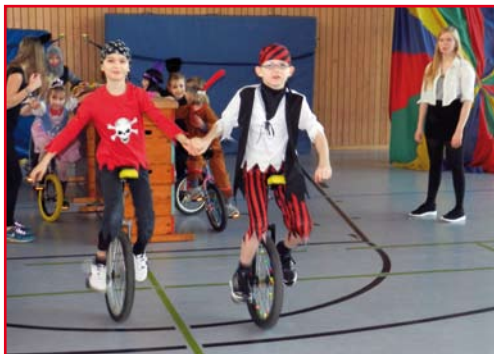
Einradfasching in Ochsenwerder / Fünfhausen